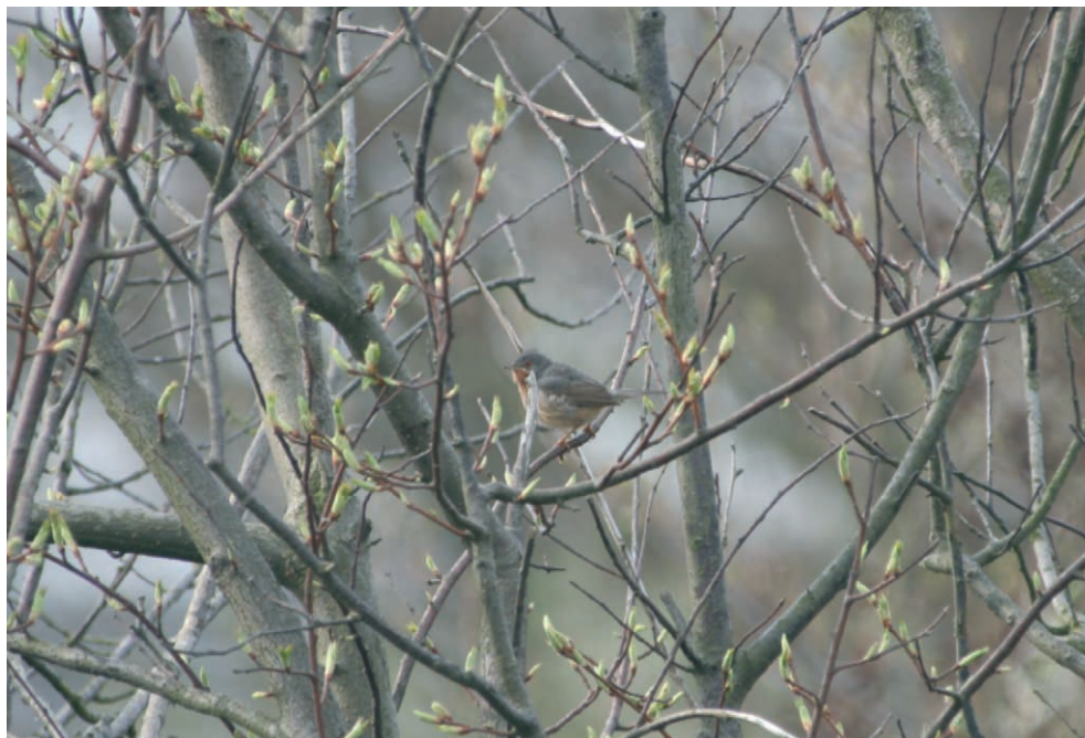
Fot. 19. Pokrzewka wąsata Sylvia cantillans , Dąbkowice, maj 2006 – Subalpine Warbler, Dąbkowice, May 2006