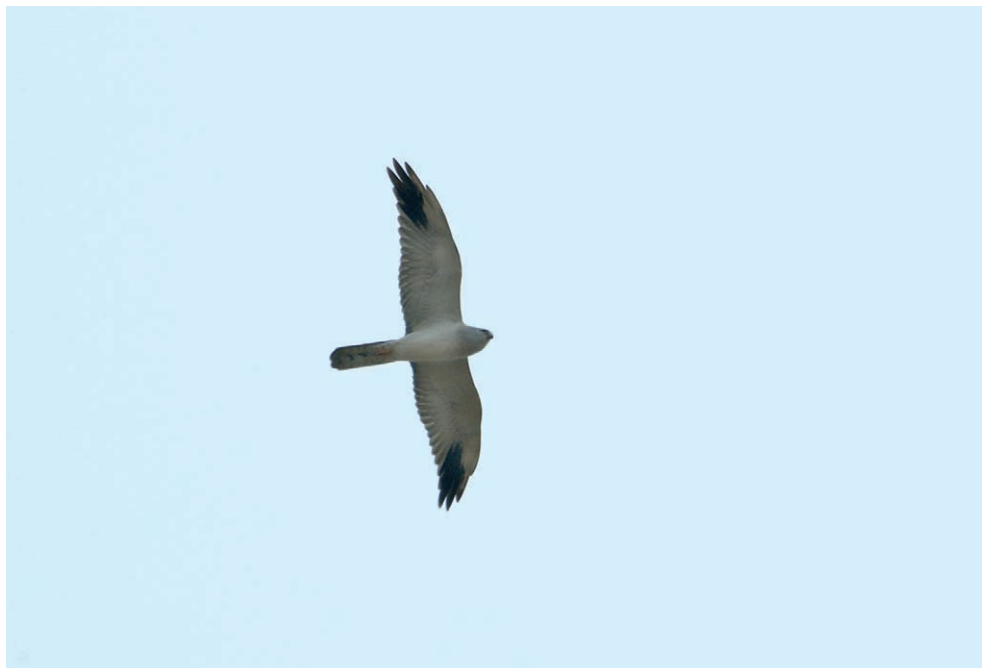
Fot. 7. Błotniak stepowy Circus macrourus , Kopytkowo, kwiecień–maj 2006 – Pallid Harrier, Kopytkowo, April–May 2006