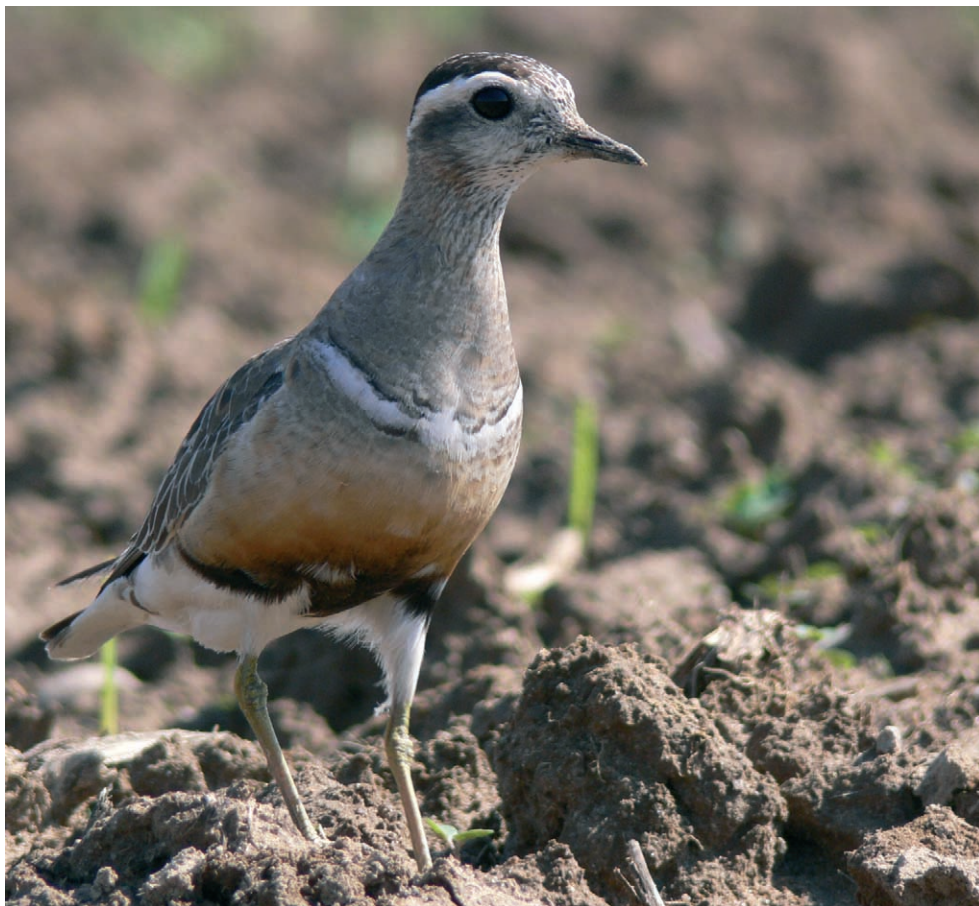
Fot. 10. Mornel Charadrius morinellus , Otok, sierpień 2006 – Dotterel, Otok, August 2006

MAŁOPOLSKIE: 30.04.06. – 1 ♂ (foto), Diablak, Babiogórski PN, pow. suski (J. Dereziński, J. Makowski); 05.09.06. – 1 juv./imm. (foto), Małofączniak, Tatry, pow. tatrzański (D. Wnuk Lipiński).