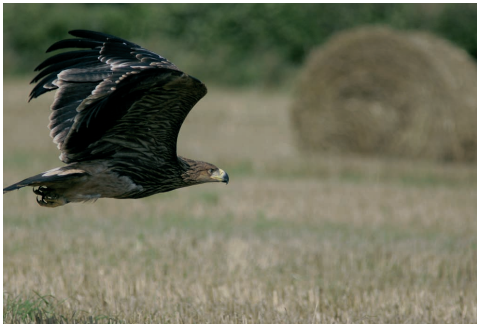
Fot. 9. Orzeł cesarski Aquila heliaca , Damienice, sierpień 2006 – Imperial Eagle, Damienice, August 2006