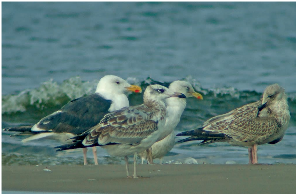
Fot. 14. Orlica Larus ichthyaetus , ujście Wisły, sierpień–wrzesień 2006 – Great Black-headed Gull, Vistula River mouth, August–September 2006

DOLNOŚLĄSKIE: 27.–29.05.06. – 1 ♂ (łęg mieszany z ♀ L. ridibundus ; foto), Ruda Żmigrodzka, pow. trzebnicki (W. Lenkiewicz, P. Kołodziejczyk).