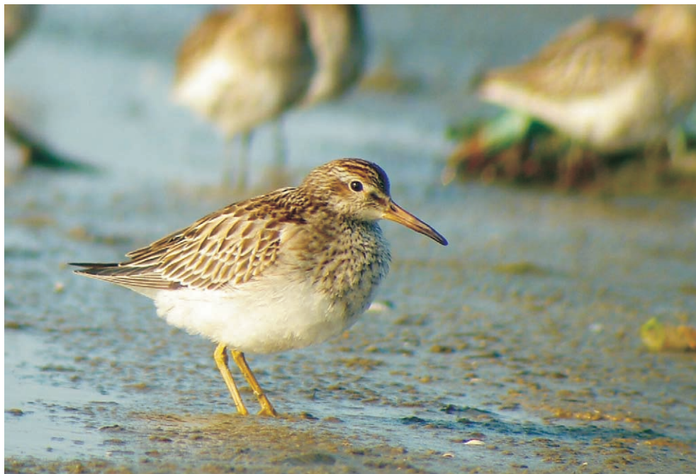
Fot. 12. Biegus arktyczny Calidris melanotos , Świnoujście, październik 2006 (fot. Ł. Ławicki) – Pectoral Sandpiper, Świnoujście, October 2006