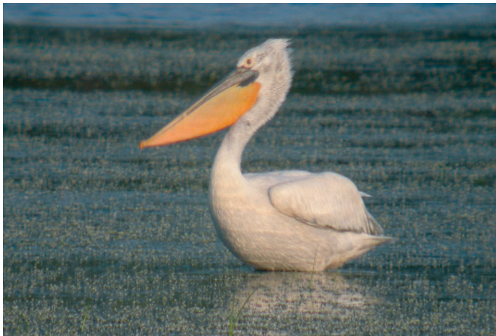
Fot. 5. Pelikan kędzierzawy Pelecanus crispus , stawy w Górkach, czerwiec 2006 – Dalmatian Pelican, Górki fish-ponds, June 2006