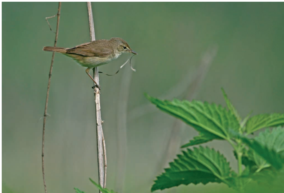
Fot. 18. Zarosłówka Acrocephalus dumetorum , Jurowce, czerwiec 2006 – Blyth's Reed Warbler, Jurowce, June 2006