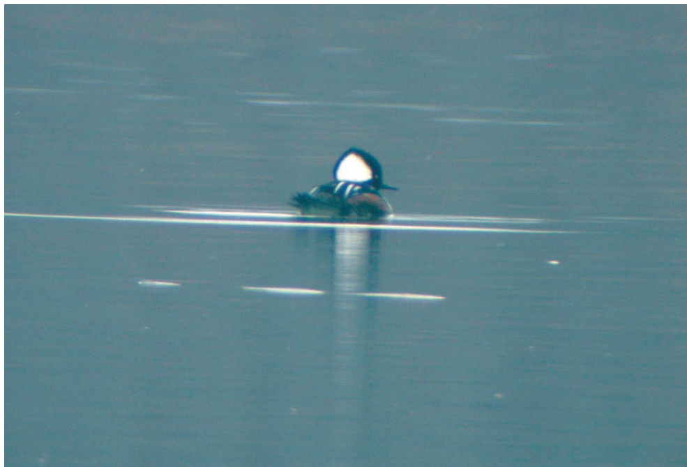
Fot. 20. Kapturzik Lophodytes cucullatus , Ruda Sułowska, grudzień 2006–styczeń 2007 – Hooded Merganser, Ruda Sułowska, December 2006–January 2007