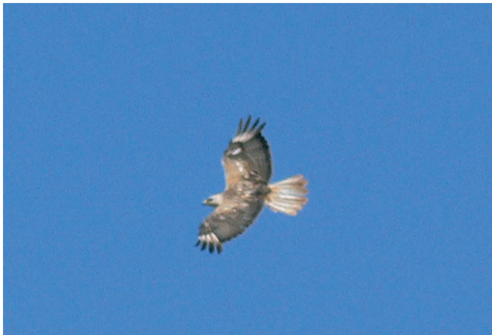
Fot. 8. Kurhannik Buteo rufinus , Młogoszyn, lipiec 2006 – Long-legged Buzzard, Młogoszyn, July 2006