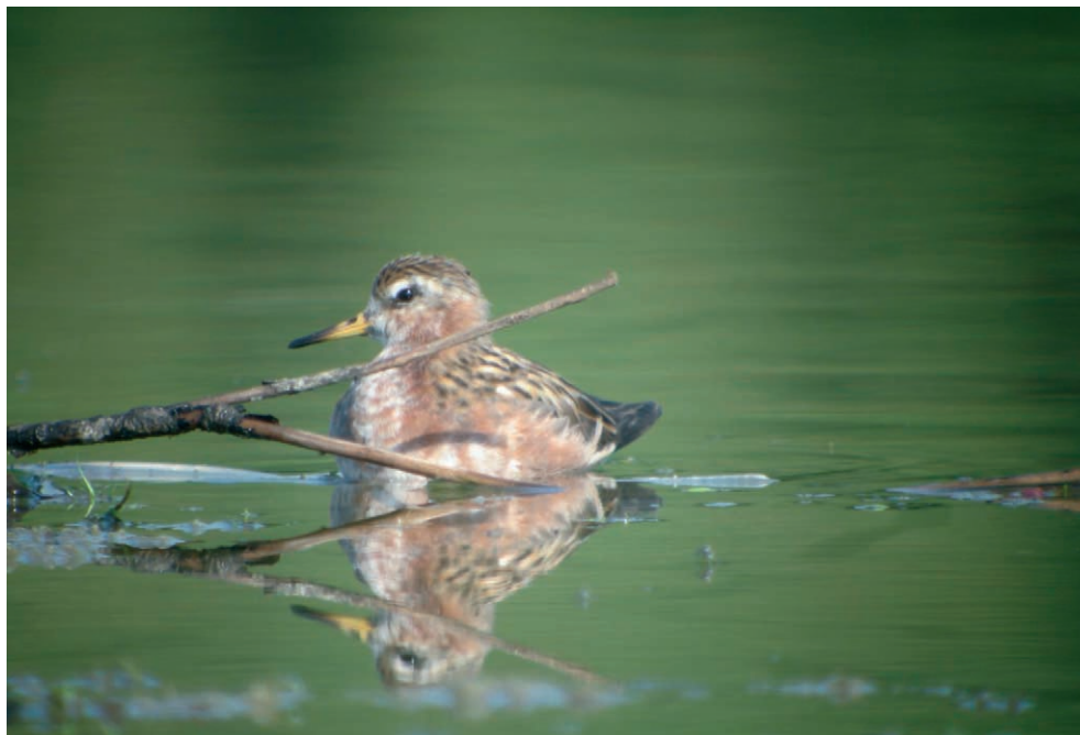
Fot. 13. Płatkonóg płaskodzioby Phalaropus fulicarius , Spytkowice, wrzesień 2006 – Grey Phalarope, Spytkowice, September 2006

POMORSKIE: 15.–16.12.06. – 1 imm. (foto), Władysławowo, pow. pucki (Z. Klawikowski, A. Kumiszczka).