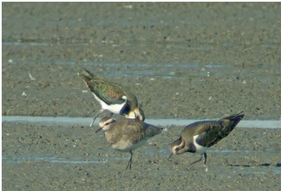
Fot. 11. Czajka towarzyska Vanellus gregarius , stawy Wielikąt, październik 2006 – Sociable Plover, Wielikąt fish-ponds, October 2006