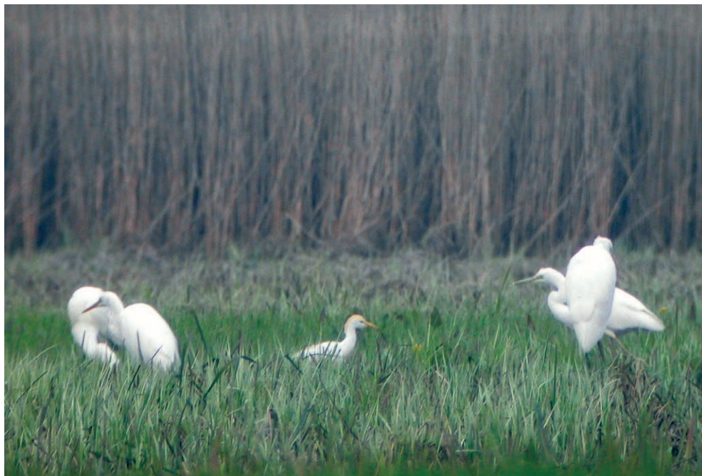
Fot. 6. Czapla złotawa Bubulcus ibis , Modlin, kwiecień–maj 2006 – Cattle Egret, Modlin, April–May 2006